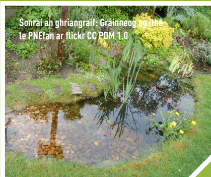
Sonraí an ghriangraif: Gráinneog ag ithe le PNEfan on flickr CC PDM 1.0

Má fhásann tú plandaí atá neamhdhiobhálach don fhiadhúlra chomh maith le torthaí agus glasraí, meallfaidh tú na mionainmhithe a bhíonn á n-ithe ag gráinneoga cosúil le ciaróga, boilb agus péisteanna. Má fhágann tú cúinne de do ghairdín ag fás go fáin agus gan é a ghearradh, beidh tearmann ag na feithidí blasta sin i rith na bliana.