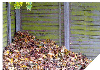
Sonraí an ghriangraif: Leaf Pile, bishib70 on flickr CC BY-NC-ND 2.0