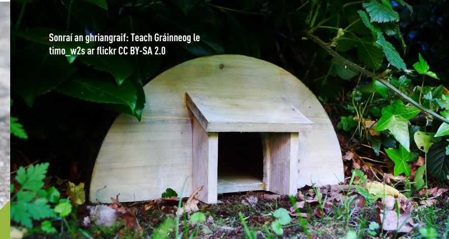
Teach Gráinneog

Má tá madraí, cait nó sionnaigh i do ghairdín, is féidir leat spás le hithe atá dúnta isteach a dhéanamh do ghráinneoga as seanbhosca stórála plaisteach. Féach anseo https://www.hedgehogstreet.org/help-hedgehogs/feed-hedgehogs/