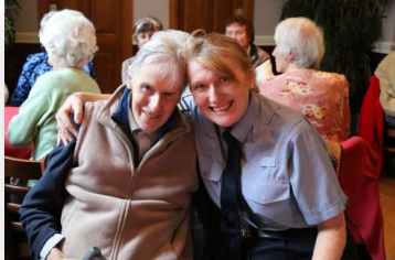
Fíor 8 Damhsa Tae Daoine Scothaosta an Gharda Síochána

cheiliúrann cruthaitheacht de réir mar a théimid in aois, a reachtáil.