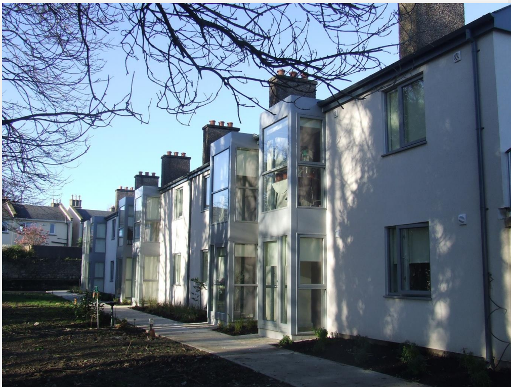
Fíor 3 Teach Bhaile an Róistigh

Is é polasaí CCDLR (Plean Forbartha an Chontae Rún 9) go mbeadh tograí cóiríochta do dhaoine scothaosta lonnaithe i limistéir cónaithe atá ann cheana le seirbhísí maithe bonneagair shóisialta agus conláistí mar líonraí cosán, siopaí áitiúla agus iompar poiblí iontu, ionas nach mbeidh áitritheoirí scoite amach agus go mbeadh cúram, neamhspleáchas agus rochtain níos fearr ar fáil sa phobal.