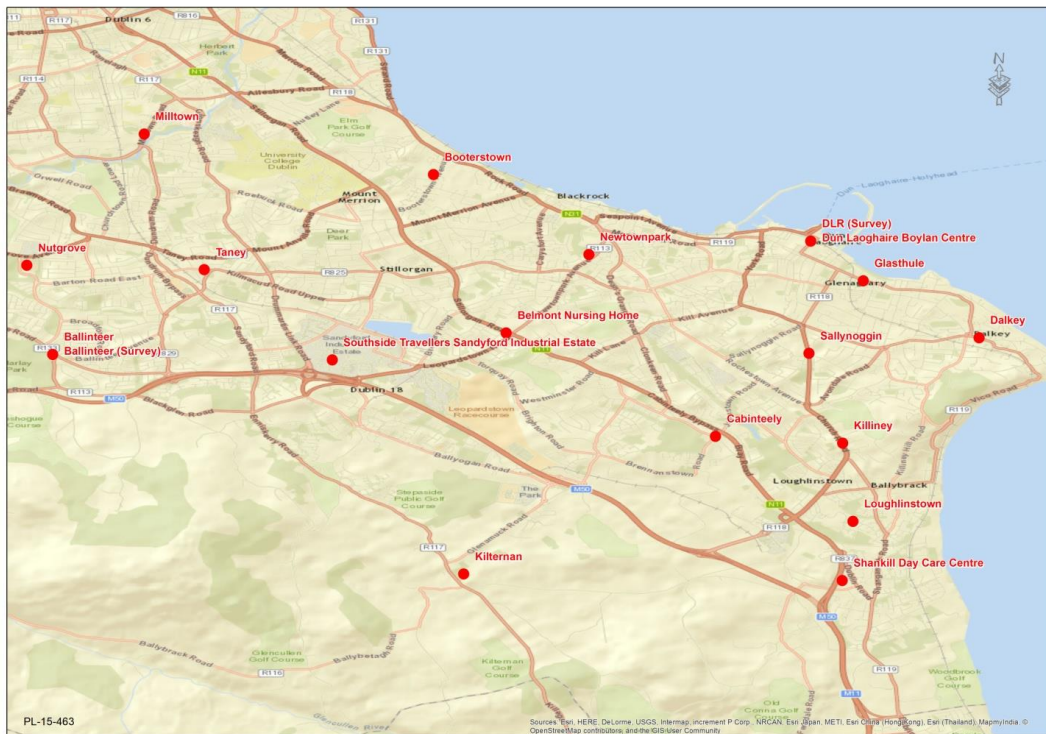
Fíor 2 Ionaid na gComhchomhairlí

Ina theannta sin, go déanach i Samhradh agus ibhFomhar 2015, le tacaíocht ó Dhaonchairdeas an Atlantaigh, tugadh faoi shuirbhé, mar chuid de chomhthionscnamh leis an Roinn Sláinte, an HSE agus Aoisbhá Éireann, chun an dul chun cinn i dtreo ‘áit iontach a dhéanamh d’Éirinn le dul in aois inti’ a thomhas. Tá an tionscadal seo ar a dtugtar “An Tionscnamh um Sláinte agus um Aosú Dearfach” (HaPAI) ag feidhmiú ar leibhéal náisiúnta agus áitiúil. Mar chuid den phróiseas seo tugadh faoi shuirbhé i DLR atá ar cheann de 21 ceantar Údaráis Áitiúil inar tharla suirbhéanna HaPAI le linn 2015 agus 2016. Cuimsíonn suirbhé HaPAI ceisteanna chomh maith, a bhaineann le gach ceann de théamaí WHO.