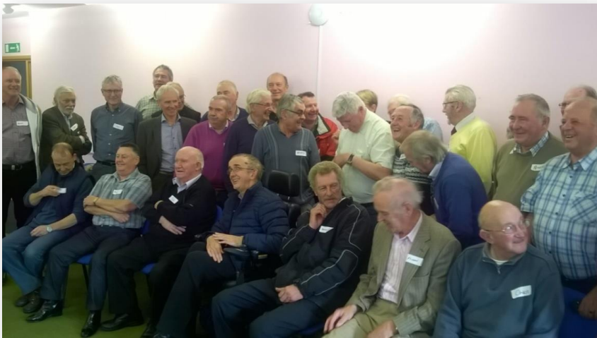
Fíor 9 Comhdháil Seideanna na bhFear 2015

Tacaíonn an tIonad Eolais do Shaoránaigh le soláthar eolais, comhairle agus abhcóideachta faoi réimse leathan seirbhísí poiblí agus sóisialta mar chearta oibre agus pinsin. Tá Ionad Eolais DLR do Shaoránaigh suite ar Shráid Clarence, Dún Laoghaire.