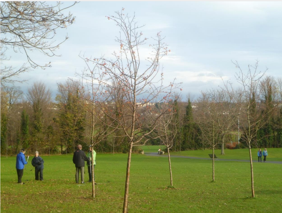
Fíor 4 Páirc Mharlaí

Chun teacht leis an bhfís de phobail inmharthana, inbhuanaithe a sheachadadh tá Forbairt Shóisialta agus Bonneagar Pobail iniata i bPlean Forbartha an Chontae 2016 -2022. Ina theannta sin, ceann de na príomhspríocanna sa Phlean Geilleagrach agus Pobail Áitiúil atá againn ná:- Pobail inbhuanaithe a fhorbairt agus tacaíocht a thabhairt dóibh sna blianta atá le teacht trí chomhtháthú ceart a dhéanamh idir thithíocht agus bonneagar sóisialta agus pobail a bheidh ar ardchaighdeán. Tá súil againn an sprioc sin a bhaint amach i gcomhoibriú lenár bpríomhpháirtithe leasmhara, comhpháirtithe agus na pobail.