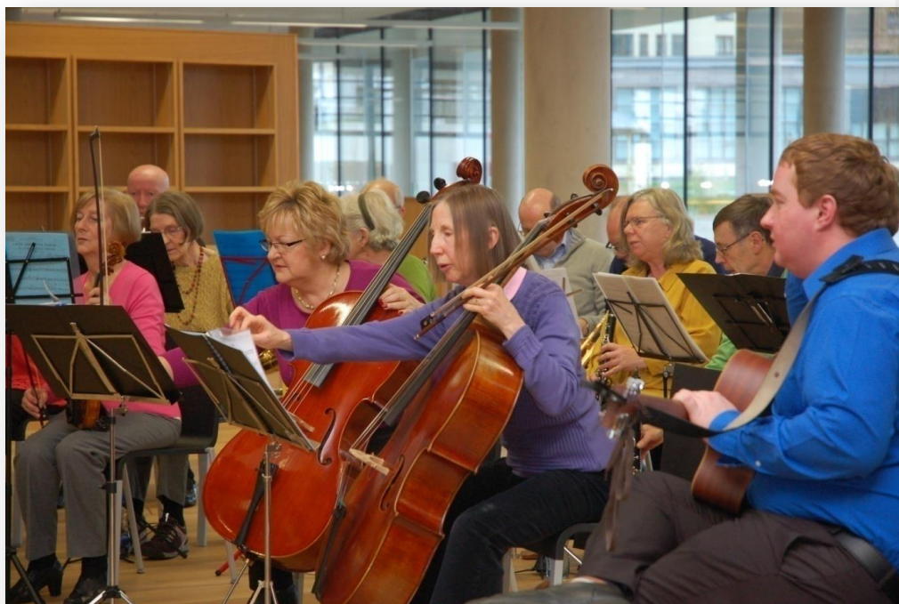
Fíor 6 Ceolfhoireann Turais Sinsearach Newpark

Déanann Network for Older People ionadaíocht thar cheann 67 grúpa gníomhaíochta lucht scoir éagsúla ar fud an chontae. Is féidir eolaire de ghrúpaí gníomhaíochta lucht scoir, mar aon le heolas eile, a fháil ag www.oldernetwork.com