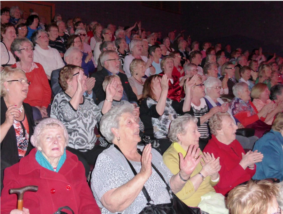
Fíor 5 Ócáid Shóisialta

Dúirt áithritheoirí ionaid cúraim fadtéarmacha go rabhadar faiteach nó imníoch faoi bheith ag braith go ró-mhór ar an Teach Altranais agus faoi a gcuid neamhspleáchas a chailleadh.