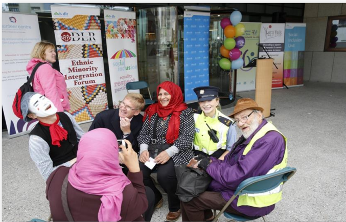
Fíor 7 Féile Cuimsithe 2014

Tá stair shaibhir comhoibríthe agus comhpháirteachais le soláthróirí eile seirbhísí poiblí, lena n-áirítear, An Garda Síochána, An HSE, Bord Oideachais agus Oiliúna Bhaile Átha Cliath/Dhún Laoghaire, an Coláiste Ollscoile, BÁC, Comhpháirtíocht an Deiscirt agus grúpaí forbartha pobal mar Ghrúpa Gníomhaíochta Southside Travellers, Fóram Comhtháite Mionlach Eitneach DLR, Líonra na nDaoine Scothaosta agus Cumann na nGardaí do Dhaoine Scothaosta, ag Aonad Forbartha agus Cuimsithe Sóisialta DLR. An comhspríoc atá againn ná le réimse tacaíochtaí a fhorbairt do phobail agus d'eagraíochtaí a fhéachann le DLR atá níos cuimsithí go sóisialta, a chruthú agus le leanúint ar aghaidh ag cur chun cinn rannpháirtíocht grúpaí leochaileacha i ngach uile gné de ghníomhaíocht, chun forbairt phearsanta agus tógáil cumais a éascú agus braistint cumasaithe agus úinéireachta maidir le gníomhaíochtaí, a thabhairt.