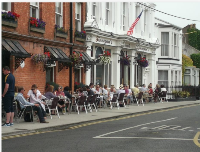
Fíor 10 An Samhradh i nDeilginis

De réir mar a théann níos mó agus níos mó seirbhísí agus eolais ar líne, tuigimid go bhfuil sé níos riachtanaí fós a chinntiú go bhfanann daoine scothaosta i dteagmháil. Agus ár Straitéis Aoisbhá á cur chun feidhme tá sé ar intinn againn ár ndícheall a dhéanamh eolas a chur ar fáil sa bhformáid agus ar an mbealach so-aimsithe is fearr leis an duine (gréasán, cruachóip, nuachtlitir) ionas gur féidir leo a bheith comhpháirteach agus rannpháirteach sa réimse leathan imeachtaí agus seirbhísí atá ar fáil sa chontae.