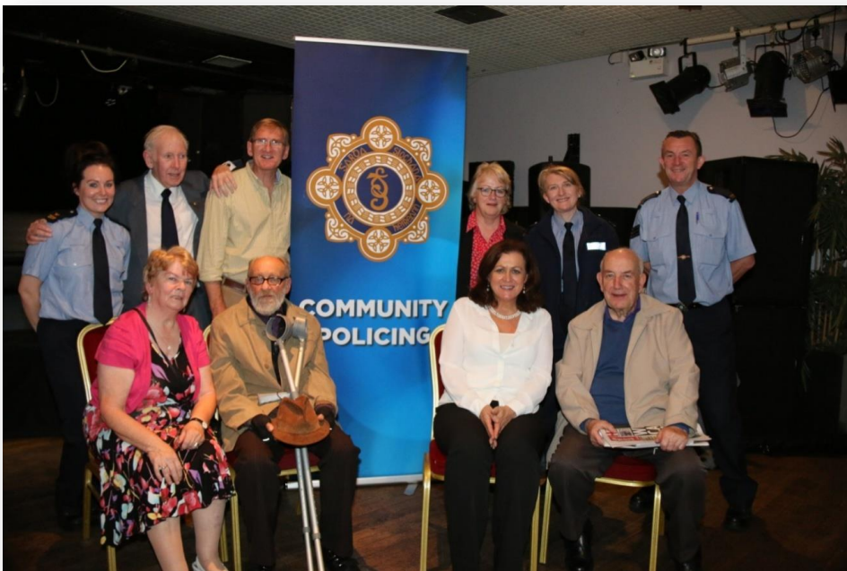
Fíor 11 Cumann Daoine Scothaosta an Garda Síochána

Tá an fhreagracht curtha ar an gComhchoiste Póilíneachta (JPC) le haghaidh Dún Laoghaire-Ráth an Dúin i leith comhordú agus cur chun feidhme gníomhaíochta a bhaineann le fóram póilíneachta a chur ar bun agus measúnú a dhéanamh ar choiriúlacht sa cheantar ar mhaithe le teacht ar bhealaí chun feabhsúcháin a dhéanamh. Leanann DLR, An Garda Síochána, ár soláthróirí seirbhísí eile agus ár gcomhpháirtithe pobail ag obair chun an contae a choinneáil slán agus taitneamhach do chách.