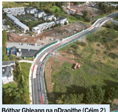
Bóthar Ghleann na nDraoithe (Céim 2)