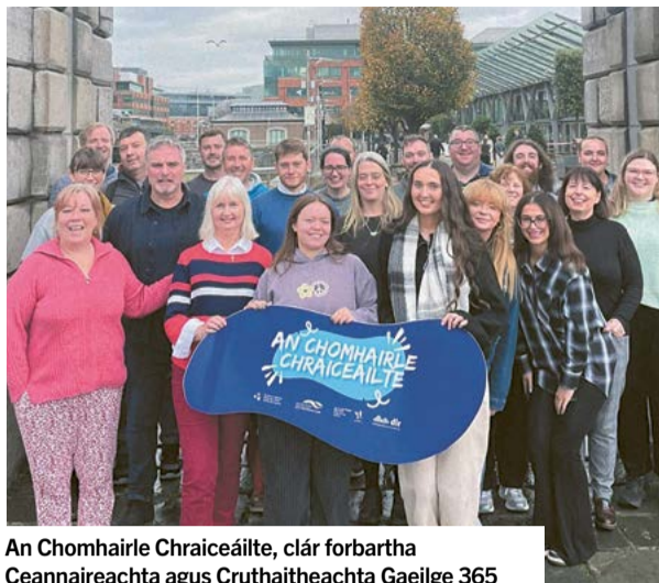
An Chomhairle Chraiceáilte, clár forbartha Ceannaireachta agus Cruthaitheachta Gaeilge 365

Ag deireadh na bliana seo, tá ról ríthábhachtach leanúnach ag Oifig na Gaeilge ag cloígh le Scéim na Gaeilge, ag cinntiú go bhfanann an Ghaeilge mar chuid infheicthe agus gníomhach d'obair na heagraíochta. Glacadh céimeanna tábhachtacha i mbliana chun feabhas a chur ar inrochtaineacht agus láithreachta na Gaeilge ar fud timpeallachtaí poiblí agus oibre.