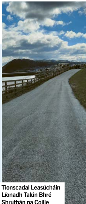
Tionscadal Leasúcháin Lónadh Talún Bhré Shruthán na Coille