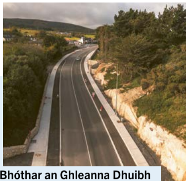
Bhóthar an Ghleanna Dhuibh