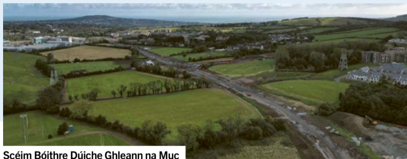
Scéim Bóithre Dúiche Ghleann na Muc