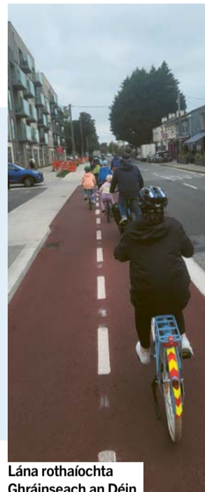
Lána rothaíochta Ghráinseach an Déin