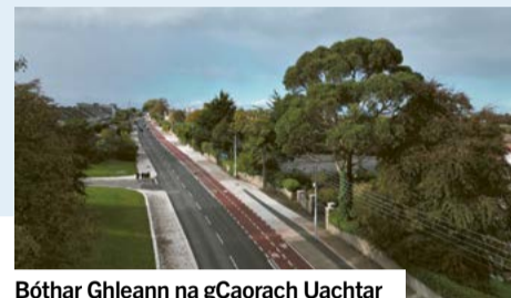
Bóthar Ghleann na gCaorach Uachtar