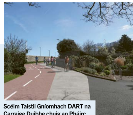
Scéim Taistil Gníomhach DART na Carraige Duibhe chuig an Pháirc